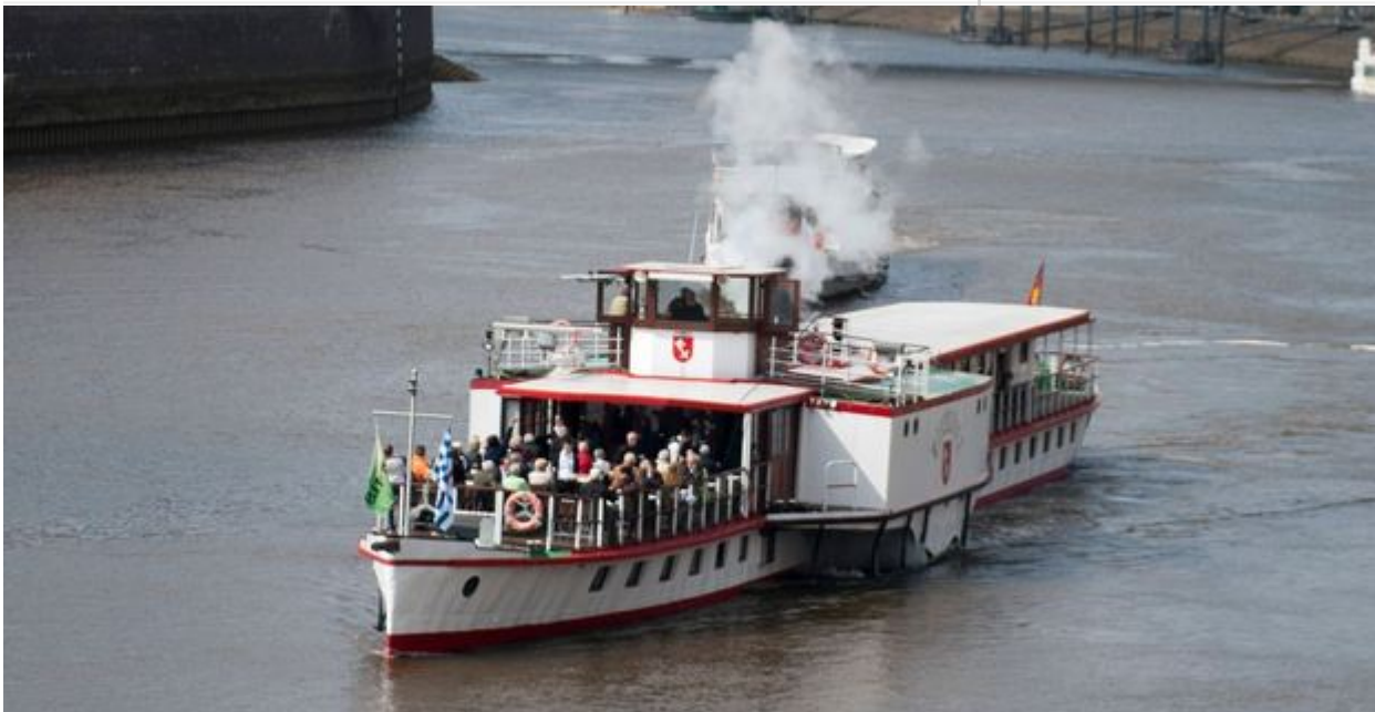
Die erste Rundfahrt der "Weserstolz" auf der Weser. (Christina Kuhaupt)

„Weserstolz“, dieser Vorschlag stammt von Hörern des Radiosenders Bremen Eins. „Unter 501 Einsendungen mit 547 Vorschlägen war das der beliebteste“, sagte Harro Koebnick von Hal über. Und „Weserstolz“ sei ein Schiffsname mit Tradition: „Von 1935 bis 1983 war bereits ein Salonschiff mit diesem Namen für die Schreiber Reederei in Bremen im Einsatz.“