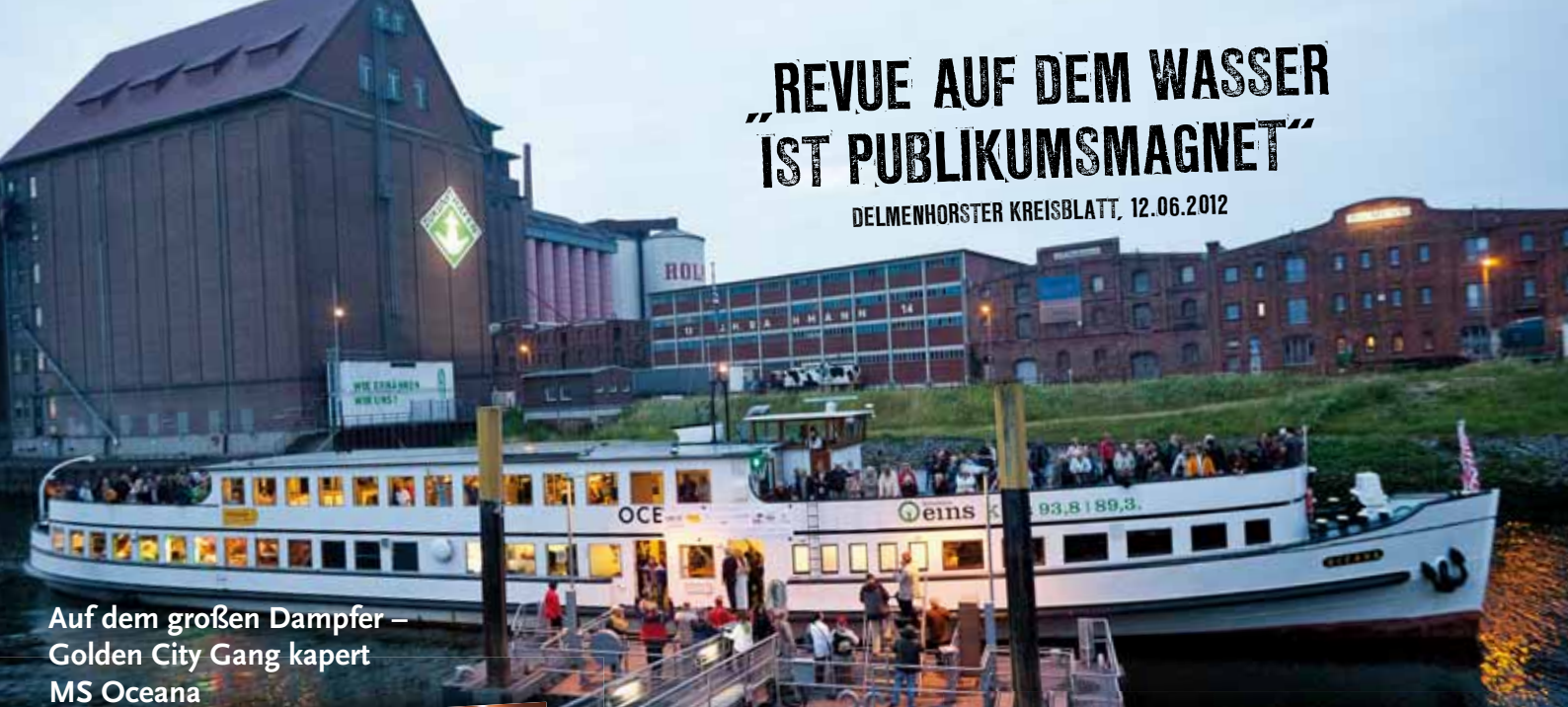
Auf dem großen Dampfer – Golden City Gang kapert MS Oceana